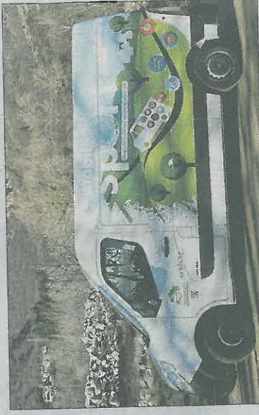
■ Pendant la phase de test, c'est le fourgon ardéchois qui fera escale en Haute-Loire. Si l'essai est concluant, le Département pourrait en acquérir un.

En Ardèche, où le concept a été initié, près de 7 000 personnes ont bénéficié des services de Mobil'sport. Dans le fourgon, il y en a pour tous les goûts. Le matériel proposé permet de pratiquer des sports collectifs (basket-ball, street hockey, baseball, rugby flag...), des jeux de raquettes (tennis, badminton, tennis de table...) mais aussi du vélo, de la pétanque ou de l'athlétisme. C'est aussi l'occasion de découvrir des disciplines originales ou méconnues comme la pétécia (un mélange de badminton et de volley), la slackline (sortie de funambulisme sur une sangle élastique), le mōlky (jeu d'adresse) ou le disc-golf (viser des trous avec un frisbee). Un éducateur sportif est présent à chaque fois que le véhicule fait escale dans une commune.