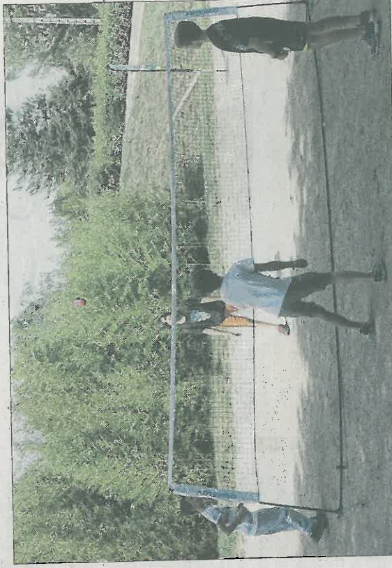
■ L'occasion de découvrir de nouveaux sports comme la pétécia.

L'idée est récente et émane du CRSMR (Comité régional du sport en milieu rural) Auvergne-Rhône-Alpes. C'est en Ardèche, en 2015, que le véhicule a fait ses premières haltes. « Il s'agit d'amener le sport où il ne peut se pratiquer de manière encadrée, faute d'équipements ou de personnel qualifié. C'est le stade qui va aux sportifs »,